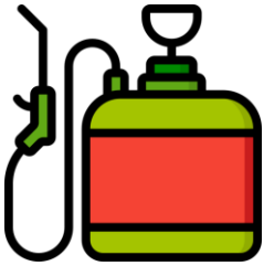
Środki ochrony roślin